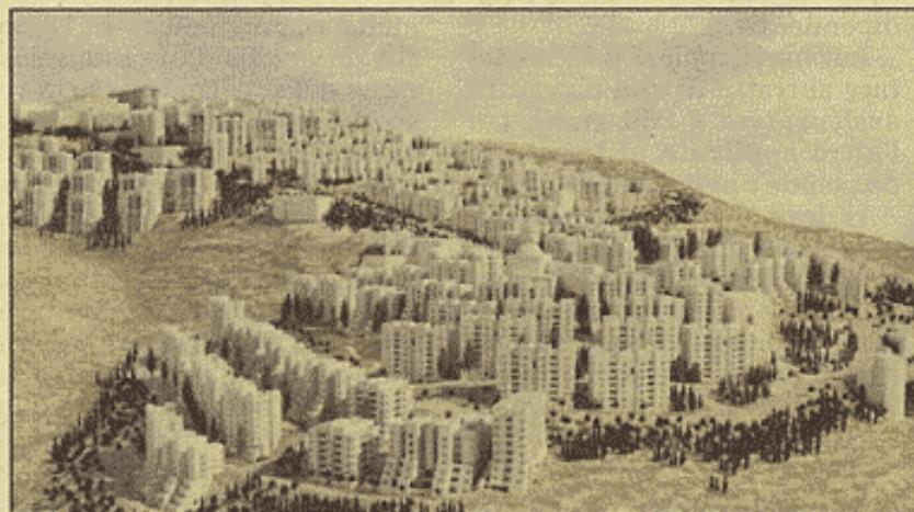
Nelle immagini, il progetto della futura città palestinese